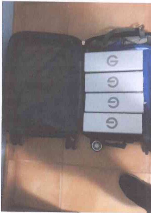
Discos duros G Raid

Descripción del tema: Cuando hablamos del traslado de los discos duros es un tema muy delicado porque cualquier golpe a los discos duros puede repercutir en los archivos finales, es como estar manipulando vidrio, y el trabajo de semanas de todo el equipo de producción se podría ver afectado, por lo que se trasladan con el mayor cuidado posible, protegiendolos de cualquier golpe o sustancia. Estos movimientos se hicieron varias veces en el transcurso del mes. Los discos duro utilizados son unos especiales de transferencia rápida y además revestidos en una carcasa de metal para extra seguridad.